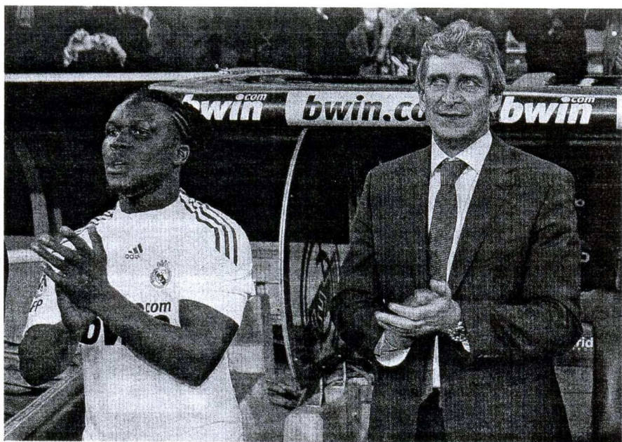
Drenthe y Pellegrini aplauden una jugada en el partido Real Madrid-Málaga del año pasado en el Bernabéu.