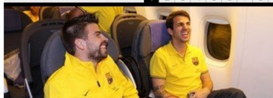
El viaje del Barça a Japón